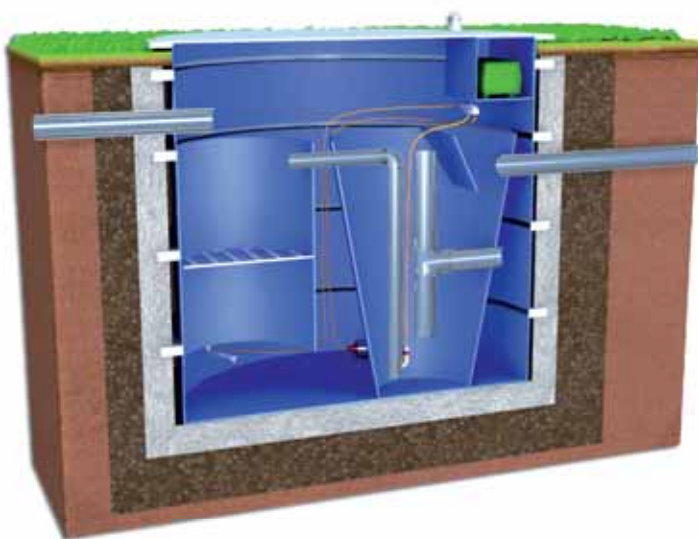
Vertikální řez ČOV TP - 8EO

Z aktivačního prostoru voda vtéká do dosedací nádrže spojovacím potrubím, kde se vyčištěná voda odděluje od aktivovaného kalu a přes odtokový systém je odváděna do kanalizace. Dosazovací prostor je kuželového tvaru, kde je recirkulace kalu zajištěna pomocí přečerpávacího potrubí zpět do nátokového prostoru. Hladina dosazovacího prostoru je provzdušňována pro rozbourání vyflotovaného kalu. Vyčištěná voda je přes odtokový systém odváděna do kanalizace, se souhlasem vodohospodářského orgánu lze tuto vyčištěnou vodu vypouštět do recipientu, dešťové kanalizace, trativodu, či jí akumulovat a použít k závlahám. Vzduchování je zajištěno membránovým dmychadlem, které je napojeno do rozvaděče vzduchu z kterého je vzduchování rozvedeno do jednotlivých částí. Membránové dmychadlo je řízeno časovými spínacími hodinami. Účinnost čištění se pohybuje v rozmezí 90-95%.